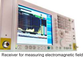
Receiver for measuring electromagnetic field

I Biomagneti al Silicio L.A.M. sono dei dispositivi funzionanti secondo i principi della tecnologia elettronica RFID passiva. Questa tecnologia permette al dispositivo di riconoscere le radiofrequenze, sulle quali è stato tarato, in modo che questi possa funzionare permanentemente senza fonte di alimentazione diretta. I Biomagneti al Silicio L.A.M. rispondono all'interno del loro raggio d'azione emettendo, in corrispondenza alle sole frequenze elettromagnetiche di disturbo, che sono presenti nell'ambiente (comprese quelle alteranti emesse dalla tecnologia 5G), un'onda con fase inversa che va ad eliminarle. In questo modo si crea una zona sferica ripulita dai segnali elettromagnetici disturbanti, nella quale tuttavia i segnali necessari per le comunicazioni rimangono presenti. A questo proposito sono stati effettuati alla FAI di Verona (Federazione Autotrasportatori Italiani) quattro importanti test con un panel di autisti (Test elettromiografico di superficie, Test optometrici, Test eye-tracking, Test di campionamento energetico) che hanno evidenziato il funzionamento positivo dei Biomagneti al Silicio L.A.M. Le cellule viventi che si trovano all'interno del loro raggio d'azione ne traggono beneficio , in quanto i segnali elettromagnetici che regolano il funzionamento delle cellule non hanno problemi di interferenza con le frequenze elettromagnetiche di disturbo e di conseguenza il loro equilibrio bioelettrico ottiene un miglioramento.