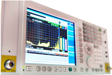
Receiver for measuring electromagnetic field