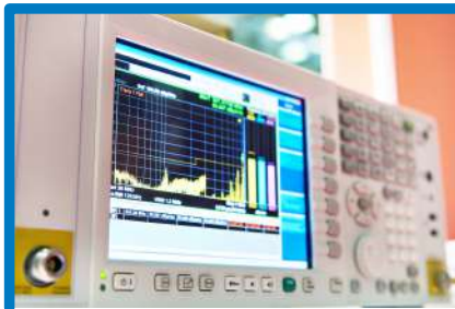
Receiver for measuring electromagnetic field